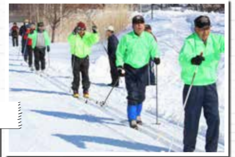
昨年の町民歩くスキーの集いの様子

2月の納期限は 27日まで 後期高齢者医療保険料、第8期納期限、町道民税第5期納期限、国民健康保険税第8期納期限