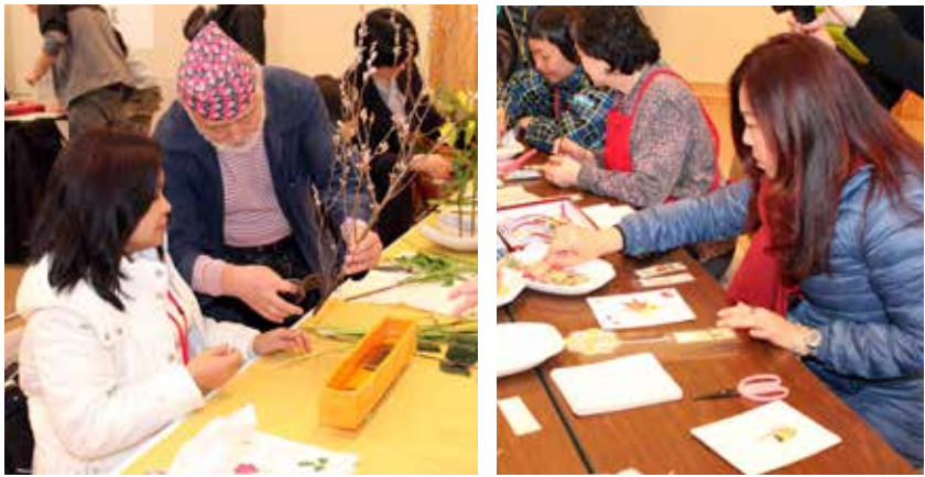
町民の皆さんの協力で大成功をおさめたスノートラベルエキスポ