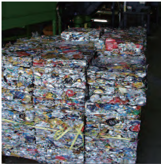
リサイクルセンター （圧縮処理された空き缶）