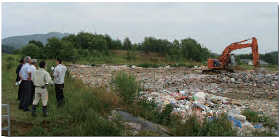
一般廃棄物最終（埋立）処分場調査